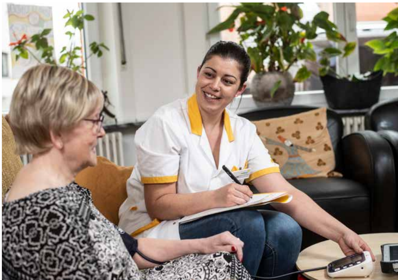
DEZE FOTO IS GENOMEN VOOR DE CORONAPANDEMIE.