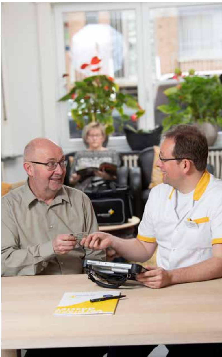
DEZE FOTO IS GENOMEN VOOR DE CORONAPANDEMIE.

Communicatie in de zorg is ontzettend belangrijk. Maar hoe doe je dat als je je spraak verliest door bijvoorbeeld een spierziekte, als je de verpleegkundige niet (meer) goed verstaat of als je door geheugenproblemen niet kan onthouden wat er vorige keer is gezegd? Je wil je verpleegkundige wel vragen stellen, maar misschien lukt het niet. Of toch niet op de 'klassieke' manier.