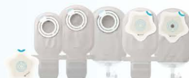
SenSura Mio Kids, pediatrie opvangzakjes