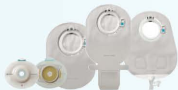
SenSura Mio Click 2-delig