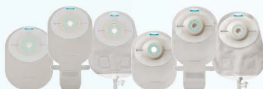
SenSura Mio 1-delig