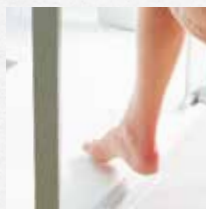
Lage instap van slechts 3 cm