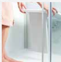
Zitje, opklapbaar en softclose