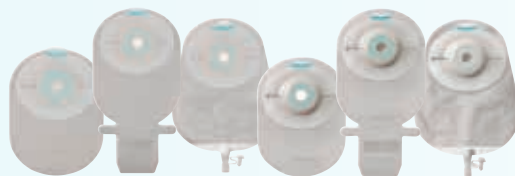
SenSura Mio 1-delig