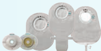
SenSura Mio Click 2-delig