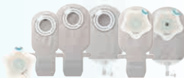
SenSura Mio Kids, pediatrische opvangzakjes