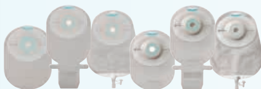
SenSura Mio 1-delig