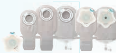
SenSura Mio Kids, pediatrie opvangzakjes